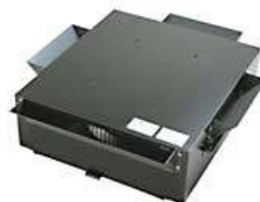
下部設置用ターボファン