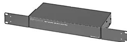
ネットワーク環境監視装置 (RP482-LC)

LANやインターネットを利用して様々な現場環境のリモート監視が可能です。 ラック搭載機器の遠隔監視に最適のソリューションです。